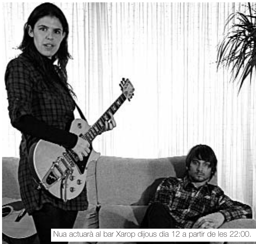
Nua actuarà al bar Xarop dijous dia 12 a partir de les 22:00.

per la AIE en la gira d’Artistes en Ruta, la qual cosa els va permetre sortir per primera vegada del territori de parla catalana i varen poder actuar a Gijon en una important sala de rock&roll.